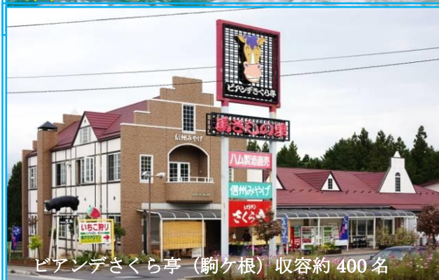
ビアンデさくら亭 (駒ヶ根) 収容約 400 名