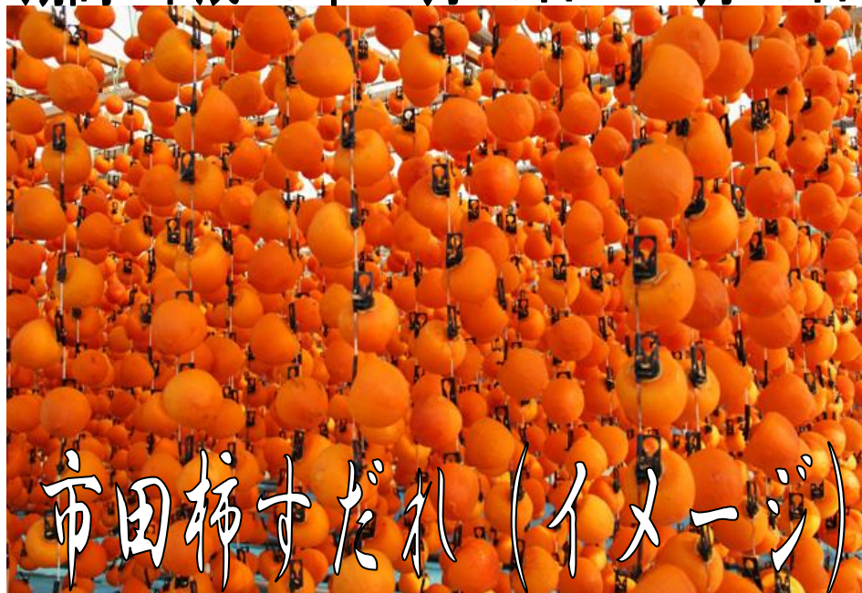
市田柿すだれ（イメージ）