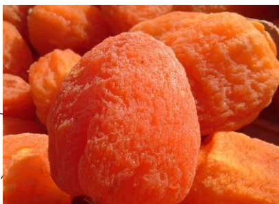
柿イメージ画像（上）

粉がふいていない状態の狩りになりますが、軽くもんで頂き冷蔵庫で保管すると粉がふきます。