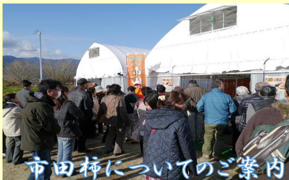
市田柿についてのご案内

市田柿狩りの手配、精算窓口、各種お問い合わせはピアンデさくら亭へお願い致します。