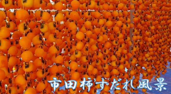
市田柿すだれ風景

市田柿狩りの手配、精算窓口、各種お問い合わせはピアンデさくら亭へお願い致します。