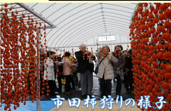
市田柿狩りの様子