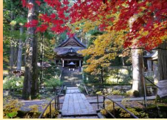
光前寺 (10月下旬~11月上旬)