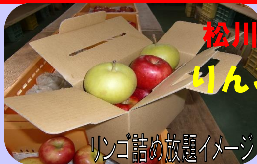
りんご詰め放題イメージ

モデルコース *予約状況で園地の対応が困難な場合は行程変更を依頼する場合がございます。