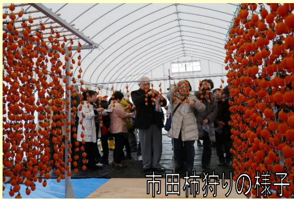
市田柿狩りの様子