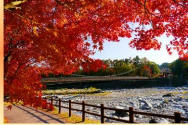
駒ヶ根高原 (10月下旬~11月上旬)