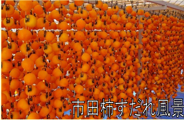
市田柿すだれ風景

市田柿狩りの手配、精算窓口、各種お問い合わせ せはピアンデさくら亭へお願い致します。