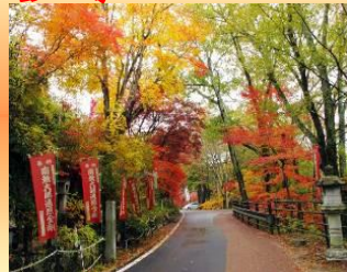
天竜峡遊歩道 (11月上旬~)