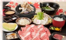
和牛しゃぶしゃぶ焼き松茸膳