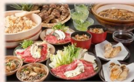
松茸すき焼き・松茸天ぷら食べ放題