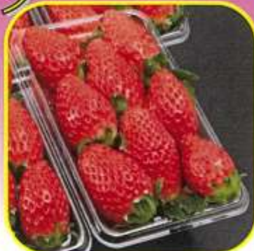
いちご1パック 500円込

こちらは、利用日2日前を最終締め切りとし以降の数量変更は出来ませんのでご了承下さい。