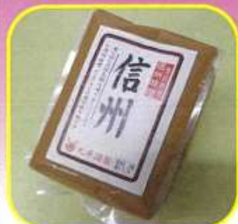
信州味噌 500g 200円込