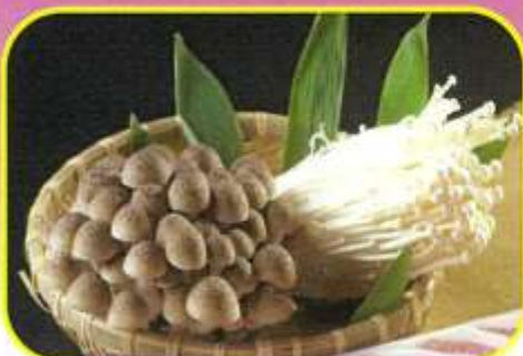
しめじ・えのき各 200g 300円込